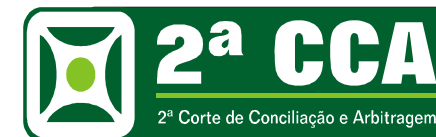
Tabela de Custas 2ª CCA